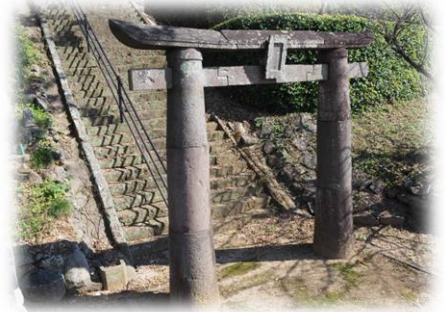
うしのおじんじゃ ▲牛尾神社の石鳥居