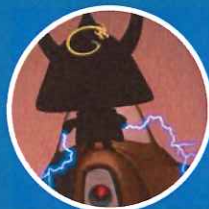
エピソード0 【謎の侵略者あらわる!】