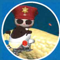
エピソード1 【見えない敵の恐怖!】