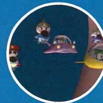
エピソード3 【キャンサー団との決戦!】