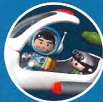
エピソード2 【ジュジョーの試練!】